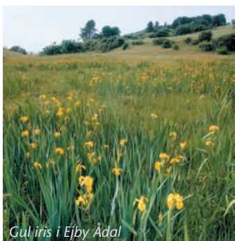
Gul iris i Ejby Ådal

Fra Ejby Havn til Kyndeløse Nordmark ligger de fredede kystskrænter, der ligesom Ejby Ådal (8) er af stor geologisk og botanisk interesse. Kystskrænterne består af smeltevandsgrus og er dannet under sidste istid. Vandstanden i havområderne omkring Danmark lå dengang væsentlig over nuværende niveau på grund af isens afsmeltning. I takt med at vandstanden gradvis faldt, og at landet for ca. 10.000 år siden begyndte at hæve sig, opstod kystskrænterne. Selve ådalen blev fredet i 1948 mens kystskrænterne blev fredet i 1994. Den gamle fredning sørgede for at sommerhusbebyggelsen ikke bredte sig til ådalen. Med den nye fredning er der kommet forbud mod opgravning af