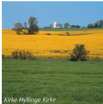
Kirke Hyllinge Kirke

På egnen omkring Ejby findes en række velbevarede landsbyer, der ligger omgivet af det dyrkede landbrugsland. Flere af landsbyerne blev ved udskiftningen omkring 1800 udskiftet i stjerneform, hvor landsbykernen er stjernens midtpunkt. Landsbyens jord blev delt i trekantede lodder, der strålede ud fra den enkelte gård i landsbykernen. På den måde kunne næsten alle gårde i små landsbyer blive liggende i landsbykernen i en kreds omkring gadekær og forte. Forten var et fælles græsareal, der før udskiftningen blev brugt til at samle husdyrene på, når de skulle vandes, og når de blev ført til og fra overdrevet. Nørre Hyllinge (12)